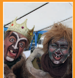
Show for barn